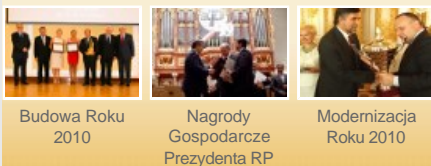
Budowa Roku 2010