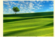
Nowe inwestycje w Tomaszowie, Pruszkowie i Zduńskiej Woli