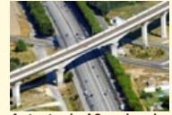
Autostrada A2 podnosi atrakcyjność Grodziska Mazowieckiego