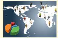
Firmy nie interesują się eksportem