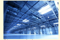
Pierwsze hale produkcyjne powstają na terenie Parku Przemysłowo-Technologicznego "Maszynowa"