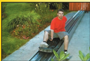
Hamownia, hamulce odśrodkowe