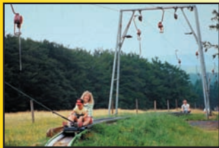
Wykorzystanie wyciągów orczykowych w lecie