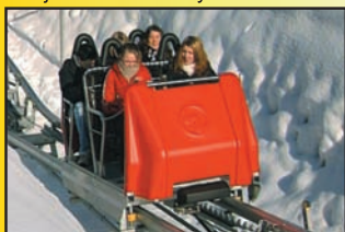
System transportu Wie-Li®