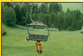
Automatyczny system transportu kolejami krzesłkowymi