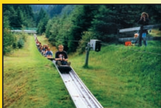
Automatyczny system wyciągania